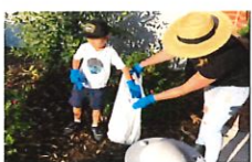
Clean Our Campus

El Distrito Escolar de Mesa Union está ofreciendo una oportunidad única a un número limitado de estudiantes que no viven en el área de asistencia del Distrito de Mesa Union para inscribirse en el distrito. Bajo la opción de Distrito de Elección, no es necesario obtener permiso del distrito de residencia. Más información y formas de registro estarán disponibles en Mesa Matters la próxima semana. Por favor, vea los documentos adjuntos para más información sobre la Elección de Distrito y la aplicación.